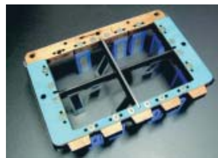
Рис. 2. Версия 1 разделяющей решетки системы lightblanker

Здесь учтены направляющие элементы решетки (соответственно гибкие или жесткие направляющие разделители для двойной высечки). Разделительные балки соединены специальными пазами, затем сварены и смонтированы на фанерную рамку. В фанерную рамку также интегрированы следующие детали: