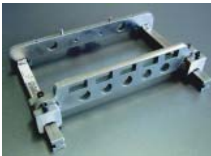
Рис. 1. Универсальная базовая рама

Базовая рама нижней оснастки (рис. 1) включает в себя две продольные и две поперечные балки. В отличие от задней поперечной балки остальные жестко скреплены друг с другом. Задняя поперечная балка используется для быстрого закрепления разделительной маски, она опирается на продольные