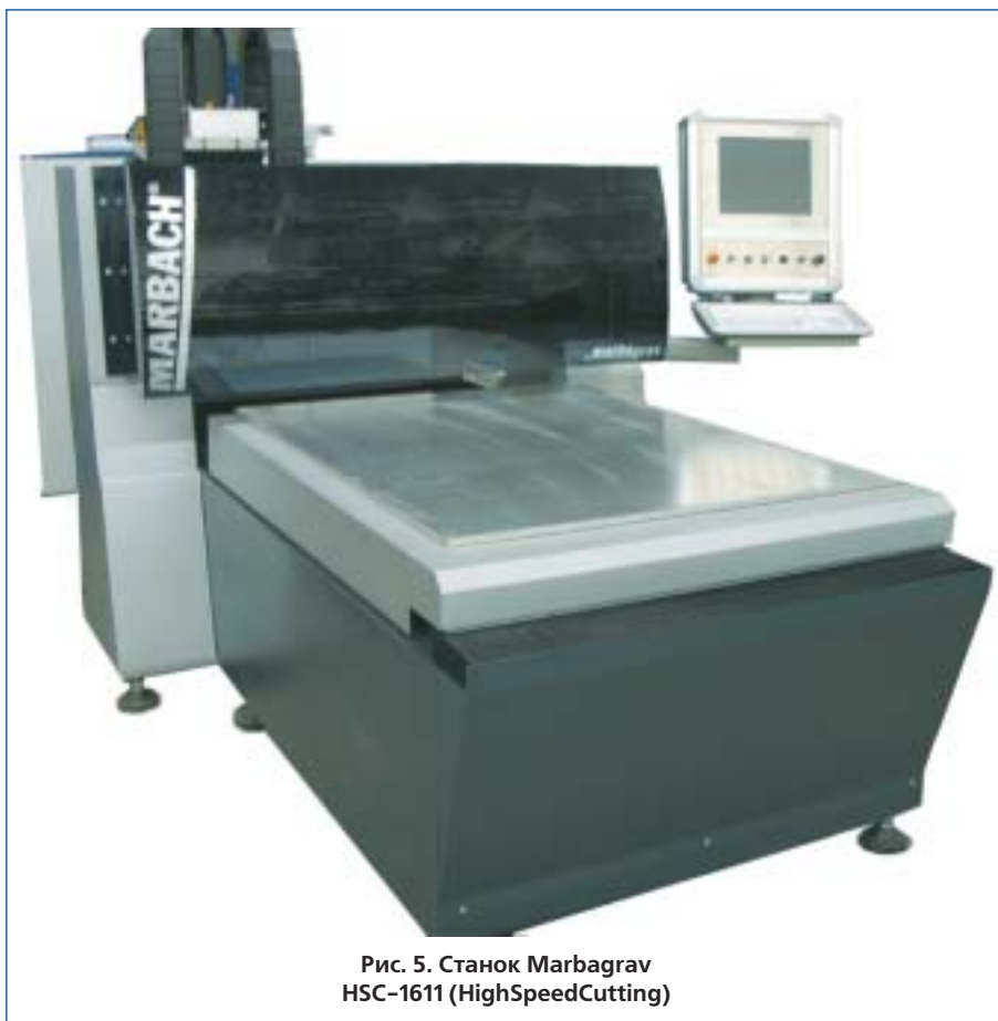
Рис. 5. Станок Marbagrav HSC-1611 (HighSpeedCutting)

производства оснастки разделения заготовок lightblanker в первом полугодии текущего года.