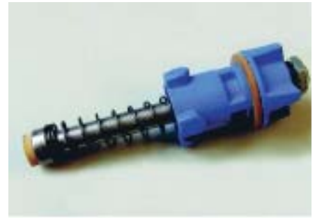
Рис. 4. Быстросъемный (запатентованный) прижим marbarpusher

В начале исследовательской работы специалисты MARBACH размышляли об использовании универсальной верхней оснастки. Но после дискуссий с клиентами они пришли к мнению, что они не много на этом выигрывают. Ведь с одной стороны доступным решением является использование универсальной машинной оснастки. Но с другой стороны штемпели, выталкивающие разделяемые заготовки, должны быть точно выровнены по отношению к балкам разделительной решетки нижней оснастки. Если это условие не выполнено – а отклонения весьма вероятны при ручном монтаже штемпелей – то разброс заготовок будет весьма значительным. Из опыта известно, что при ручной установке выравнивать штемпели точно можно только внутри штанцевальной машины, что в свою очередь негативно влияет на итоговую производительность. Эти соображения подтолкнули технологов MARBACH к тому, чтобы предложить верхнюю оснастку разделения заготовок в обычном исполнении, полностью готовом для мгновенного применения на машине. Однако при этом можно сэкономить на пружинных прижимах, используемых для прижатия боковых кромок или внутренних отходов при двойной высечке. Как уже отмечалось выше, основная область применения технологии lightblanker – это малые и средние тиражи. С точки зрения сохранения рентабельности может быть проблематичным покупать новые прижимы для каждого нового тиража с разделе-